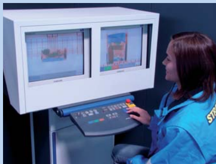
Deux vues simultanées, une image du dessus, une image du côté.

Pour prévenir ces nouvelles règles de sûreté, Streck Transport a mis en place sur son site de Freiburg une station de scannage. Neuf employés ont suivi une formation intensive dans l'analyse de l'imagerie aux rayons X. Cette formation a