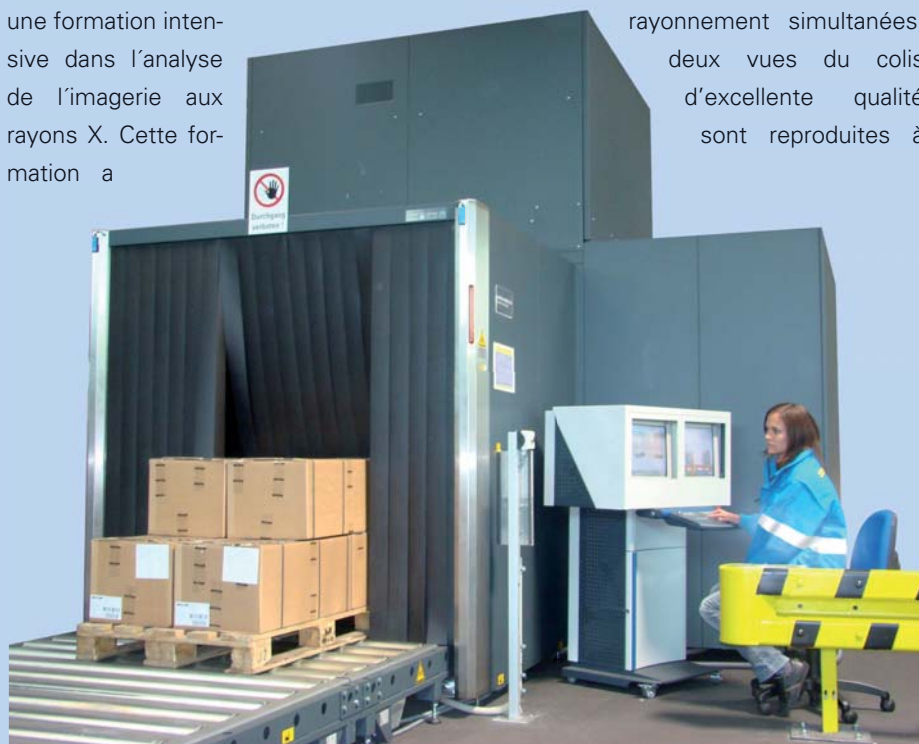
Une palette entrant dans la station de scannage

Dès à présent Streck Transport est en mesure de contrôler les marchandises quelque soit la provenance et de les faire transiter jusqu'à l'aéroport en temps que marchandise « secured ». Cela nous permet de contrôler les flux de marchandises et de gérer les départs. Les marchandises sont livrées à l'aéroport et peuvent embarquer directement à bord de l'appareil.